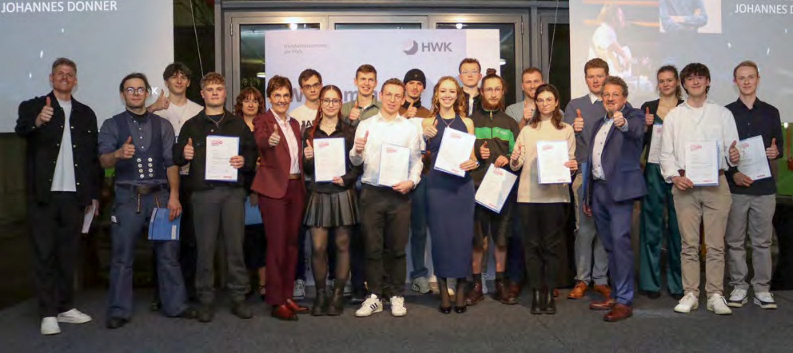
Gute Stimmung: Die Preisträgerinnen und Preisträger gemeinsam auf der Bühne